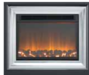
511-R + 811CH