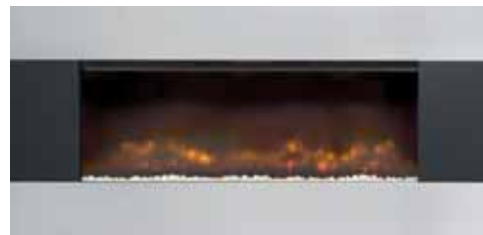
Contrast Trim 896