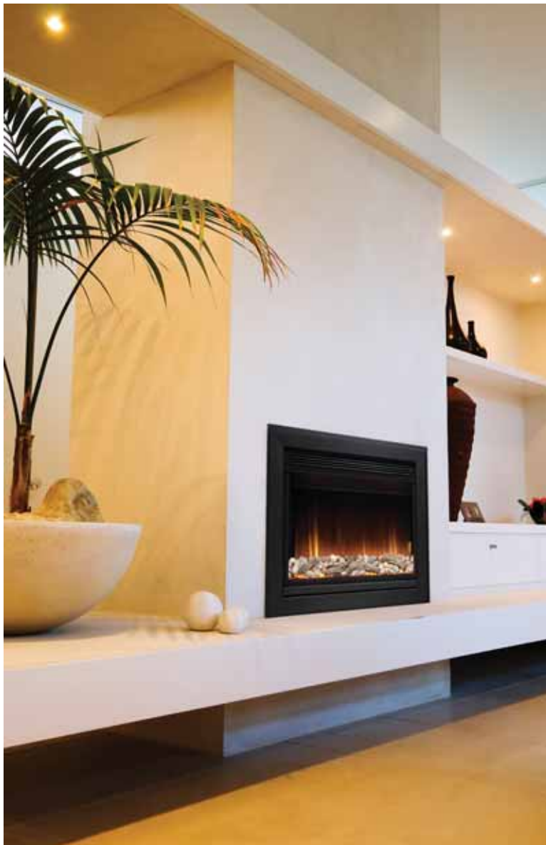
511-R + 811FBS