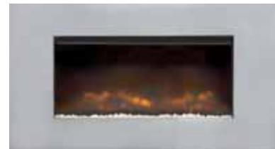
Orbital Trim 872