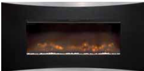
Casterton Trim 893