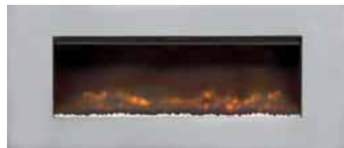
Orbital Trim 892