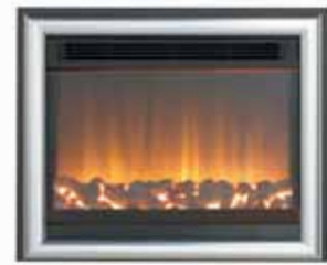
511-R + 811TTC