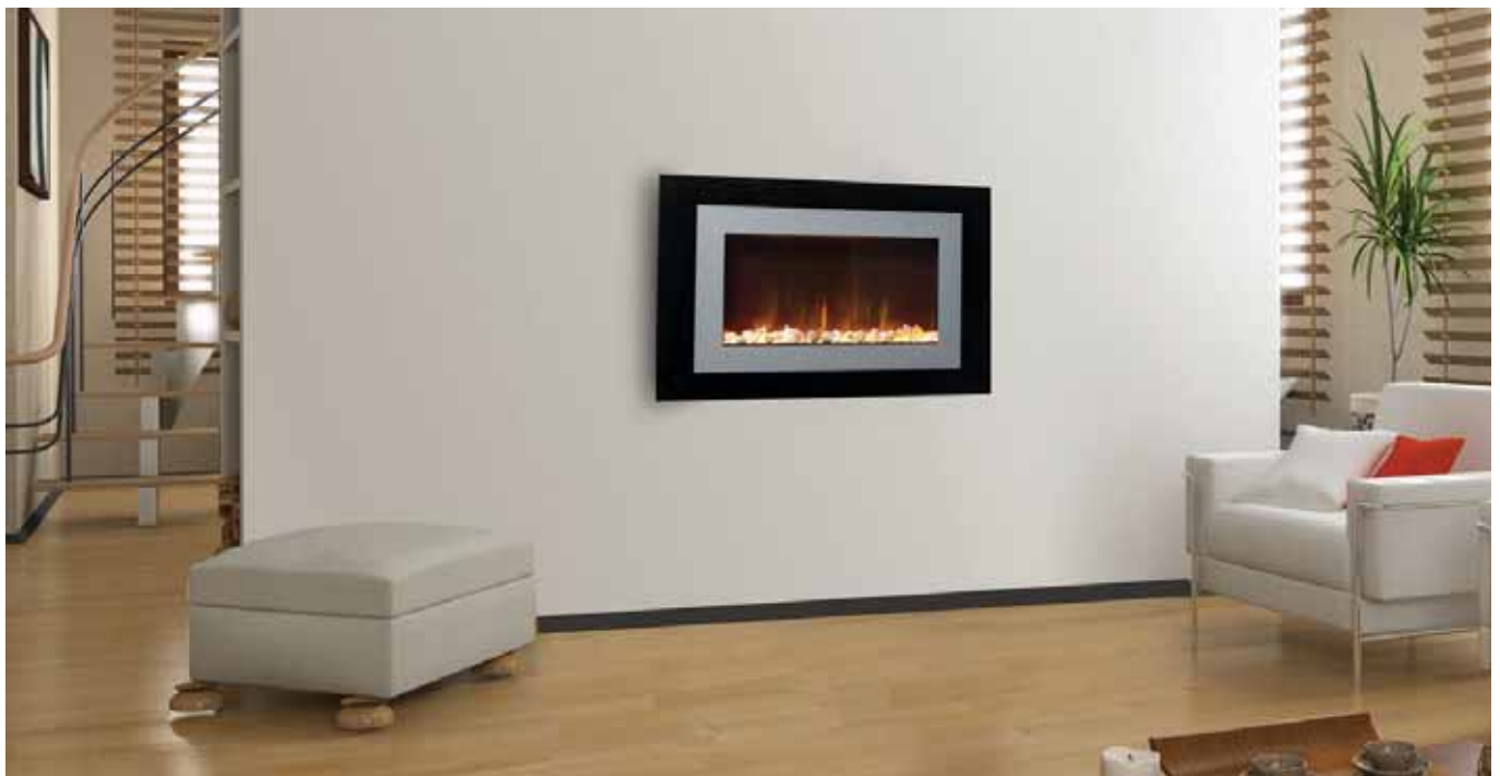
515-S Glass fascia / Glas / front en verre / glazen voorzijde / cristal