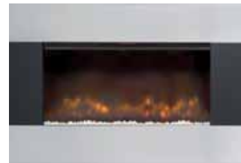
Contrast Trim 876