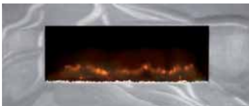
Satin Trim 891