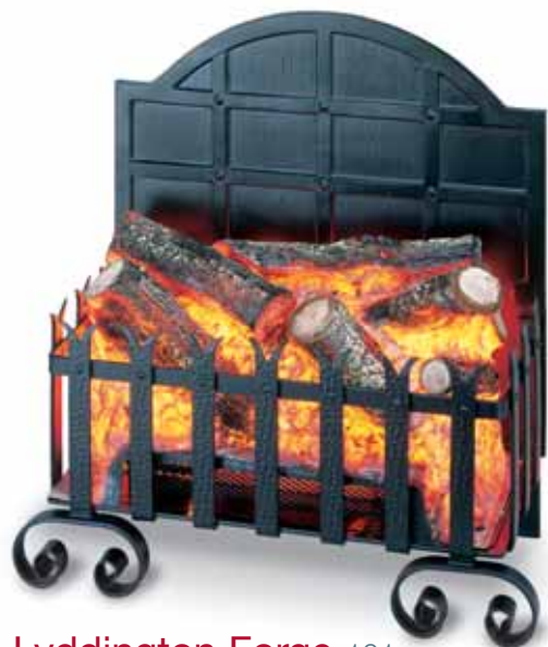
Lyddington Forge 101