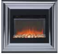
537-R + 838 trim