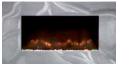
Satin Trim 871