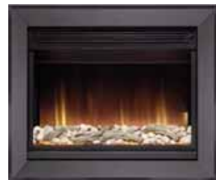
511-R + 811FBL