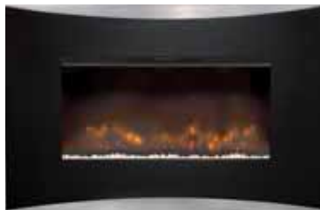
Casterton Trim 873