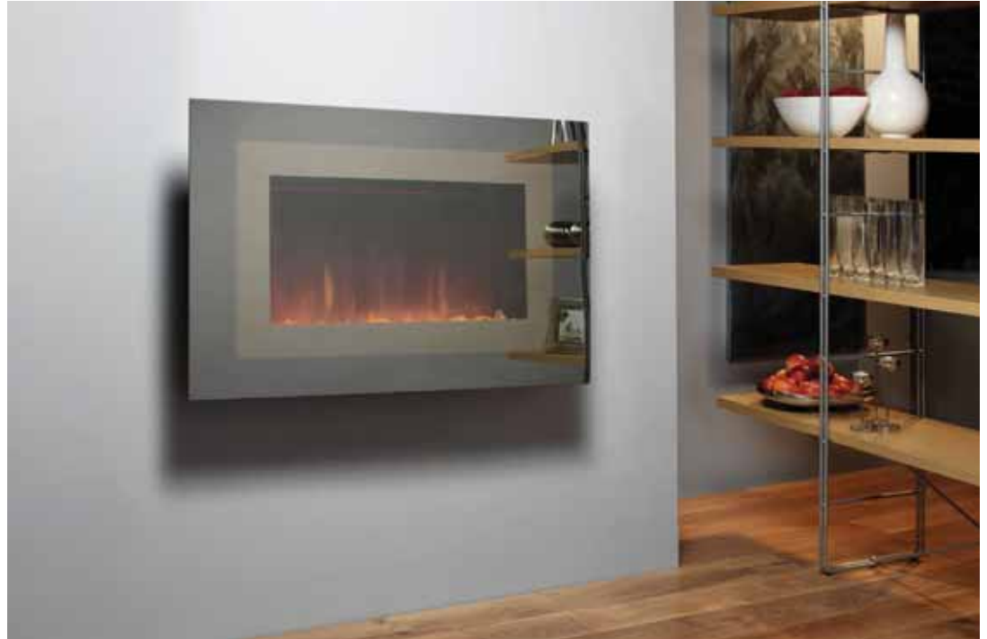
515M-S mirror front / frontale réfléchissante / Spiegelglas / espejo / spiegelende voorzijde